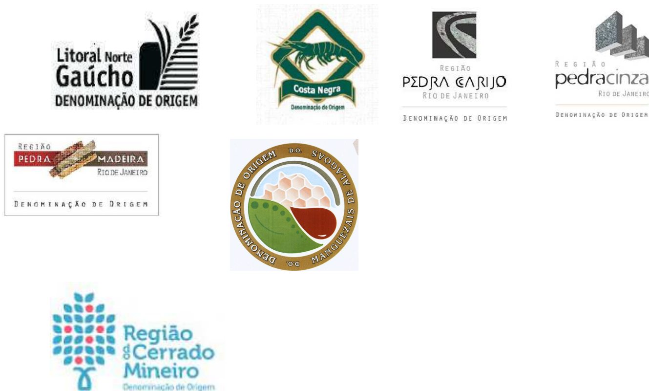
Figura 03: Sinais distintivos das Denominações de Origem brasileiras reconhecidas até abril/2014.

biodiversidade brasileira) e Vale dos Vinhedos, para vinhos tinto, branco e espumante e por fim, a Região do Cerrado Mineiro, para café.