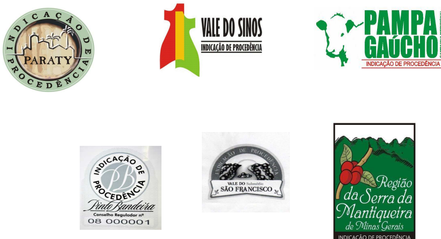
Figura 04: Sinal distintivo de algumas Indicações Geográficas brasileiras.

cidade, região ou localidade de seu território cujo nome seja Indicação Geográfica. Assim, nota-se que é possível também proteger a representação gráfica, que deve evocar a região cujo nome geográfico é protegido. Exemplos de representação gráfica das Indicações Geográficas brasileiras, além das já citadas: