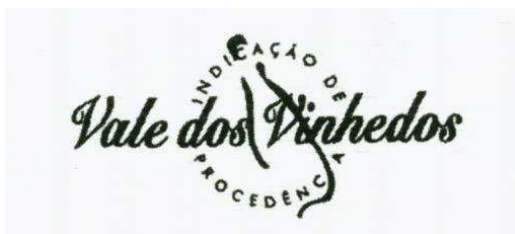
Figura 02: Sinal distintivo da indicação de procedência Vale dos Vinhedos.

A primeira Indicação Geográfica brasileira foi Vale dos Vinhedos, IG 200002, Indicação de Procedência, para vinho tinto, branco e espumantes, concedida em 19/11/2002. O fato de a região ter se tornado conhecida foi comprovado por meio de documentos mostrando que a vitivinicultura no Brasil originou-se com a colonização italiana no Rio Grande do Sul, a partir de 1886, e que os imigrantes trouxeram mudas das viníferas europeias e know-how associado, iniciando a cultura de produção vinícola no país, conquistando assim notoriedade e prestígio para a região do Vale dos Vinhedos.